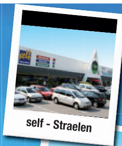
self - Straelen