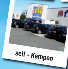
self - Kempen