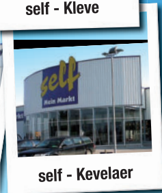
self - Kevelaer